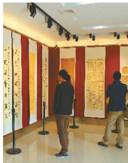
第七屆全國書法新人新作展展厅一角

“第七屆全國書法新人新作展”11月9日上午在書法聖地南京市浦口區求雨山文化名人館盛大開幕。作為大型的全國書法展覽，這次選擇在林散之、胡小石、高二適、蕭朔四個館展出，四老精品也同時展出，真正為書法藝術愛好者搭建了一座展示和交流平台。